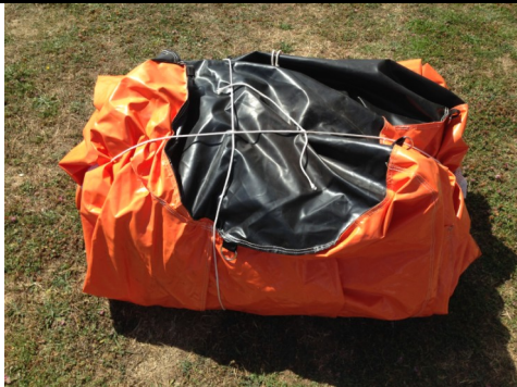
1 But Radar Gonflable