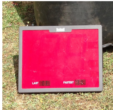
1 écran d'affichage du radar