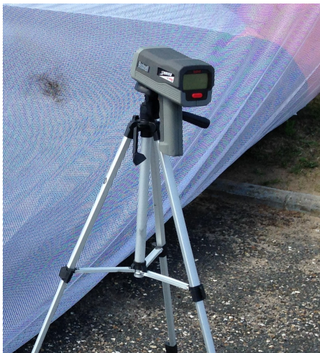
1 Radar et son trépied